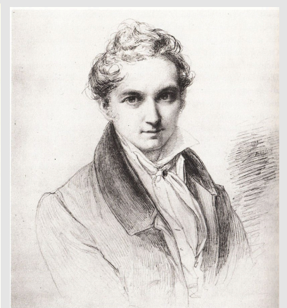
Wilhelm Hensel: Zeichnung von Fanny Hensel (1836) und Selbstbildnis (1829); Autographen der Brautleute aus dem Mendelssohn-Archiv in der Musikabteilung der SBB / Berlin

Die Billette des Verlobungsjahres 1829: SMS-Protokolle des Brautpaars Fanny Mendelssohn Bartholdy und Wilhelm Hensel